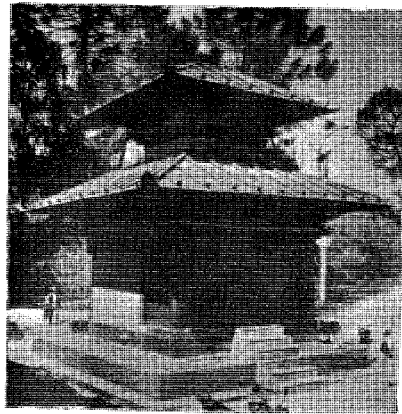
जीर्णोद्धार पश्चातको दक्षिणामूर्ति मन्दिर