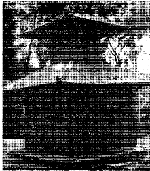
जीर्णोद्धार पुर्वको दक्षिणामूर्ति मन्दिर