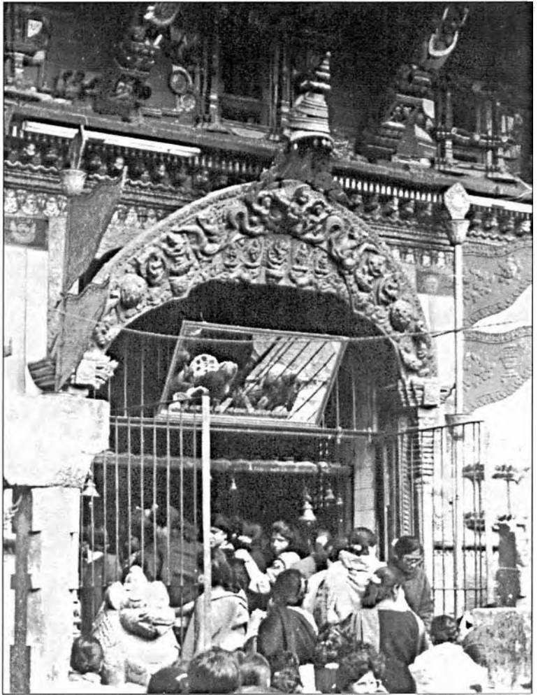
चोभार जल-विनायक मन्दिर