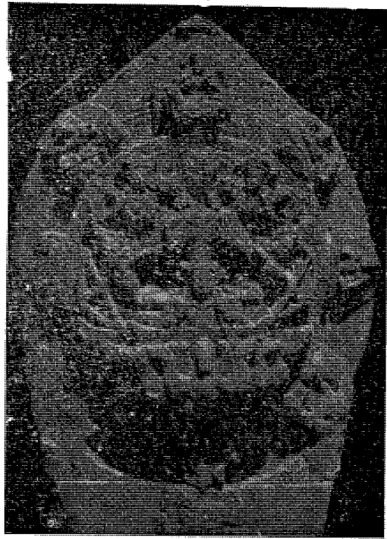
ख, ललितपुर सीगल टोलमा रहेको चन्द्रमूर्ति ।