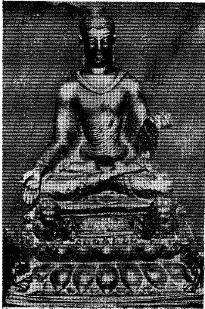
(चि. सं. १) बाह्रविसे चेकपोष्टबाट बरामद भएको अभिलेख सहितको उत्तरलिच्छविकालको बुद्धमूर्ति