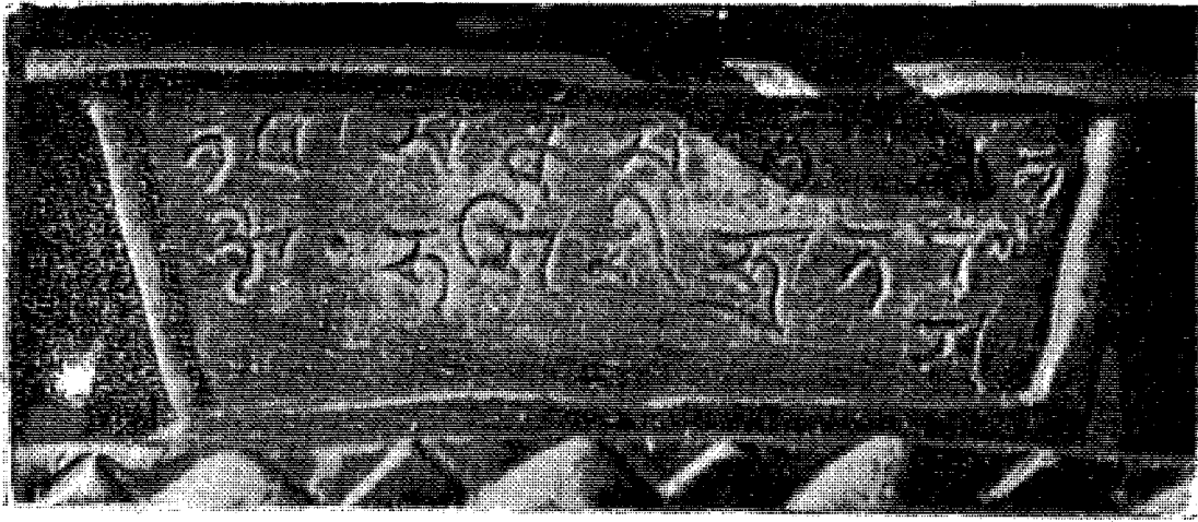
(चि. सं. ३) बुद्धमूर्तिको पादपीठको पछाडिको अभिलेख