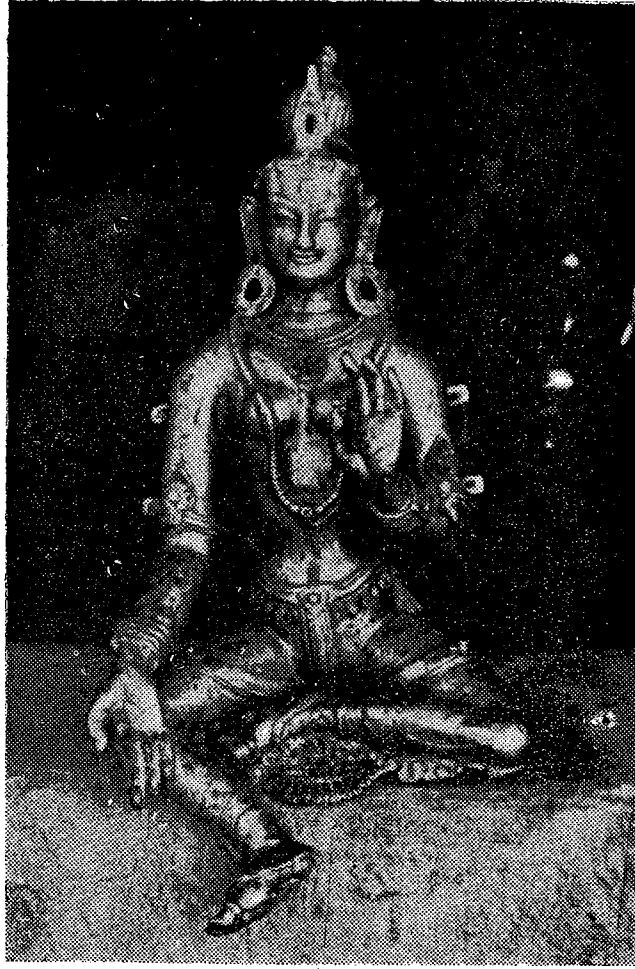
(चि. सं. ४) सुर्खेत लाटिकोइलीस्थित हराएको मूर्ति