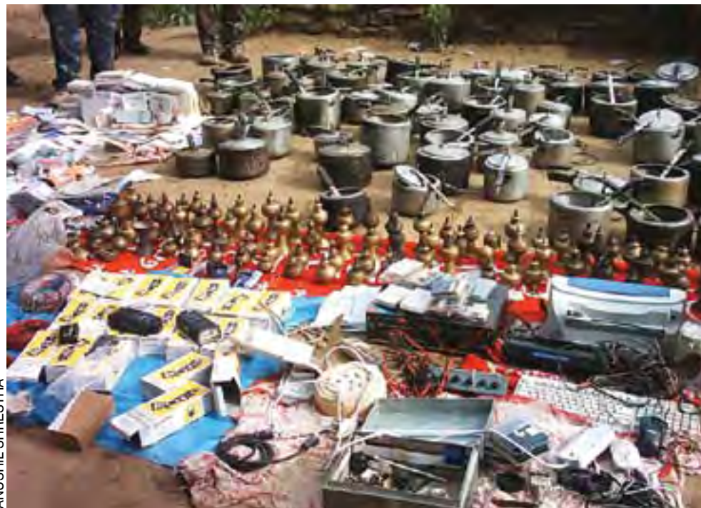
Everyday items used to produce explosive by the Maoists is seized by the security forces.