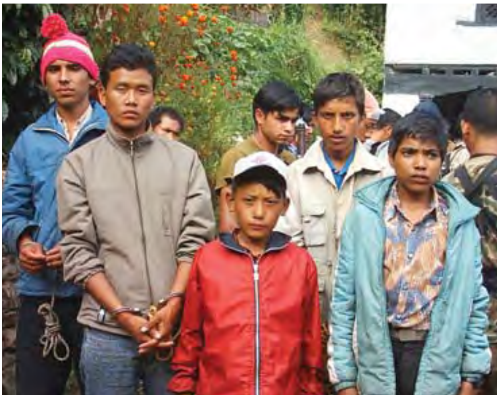
Informants for the Maoists arrested by security forces in Eastern Nepal.

थियो। सो घटनापछी आक्रोशीत गाउलेले माओवादी विरुद्ध नारावाजी गरेकाछन् भने तीन गाँउका जनताले गाँउमा माओवादिलाई प्रवेश निषेध गरेकाछन्। आन्तरिक कार्यक्रम गर्न चारसयको संख्यामा भेला भएका माओवादिले ईलामको सोयाड-८ का एक ब्राम्हण परिवारको घरमा जातीय छुवाछुत अन्त्य गर्ने भन्दै २३ कार्तिकमा दुई वटा सुँगुर काटेर भोज खाएका थिए।