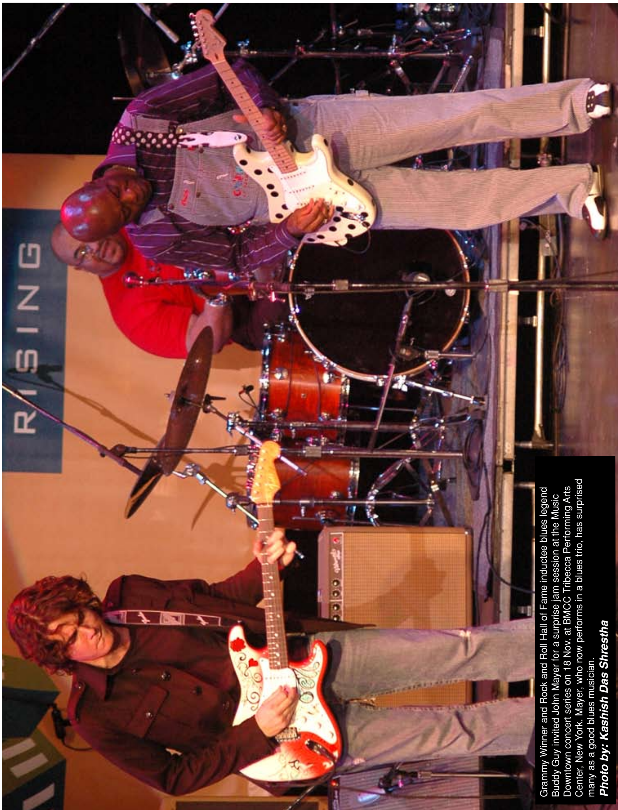
Grammy Winner and Rock and Roll Hall of Fame inductee blues legend Buddy Guy invited John Mayer for a surprise jam session at the Music Downtown concert series on 18 Nov. at BMCC Tribeca Performing Arts Center, New York. Mayer, who now performs in a blues trio, has surprised many as a good blues musician.