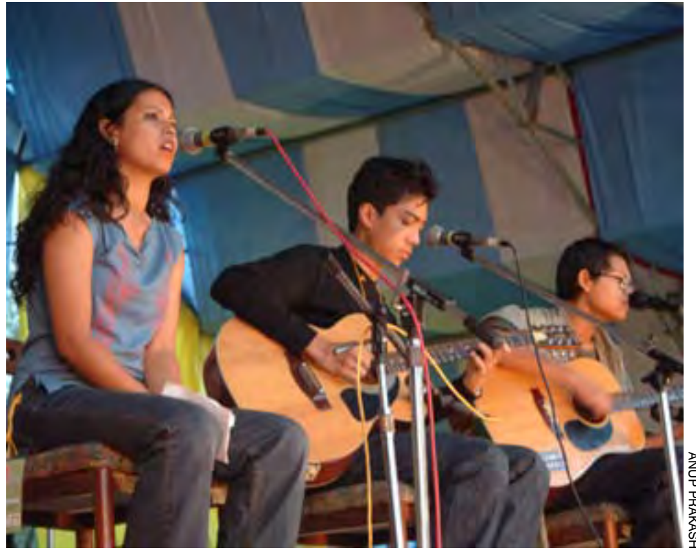
Paperboat performing at last year's WAVE Music Utsav.

Young bands get together for an unplugged session