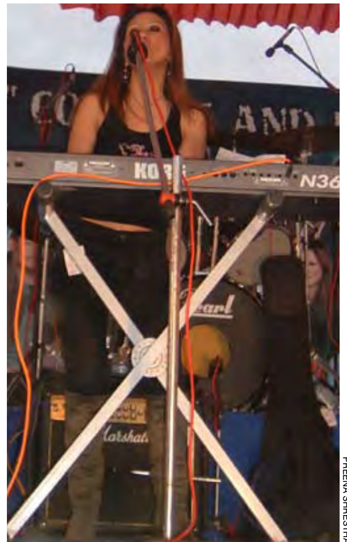
Abhaya knows how to get the crowd on its feet.

The three winning bands from the previous day started off the show, followed by progressive rock band, Atomic Bush, who had made headlines during the Rock Heads Competition last month. Playing original compositions with intricate melodies and virtuous solos, Bush put up quite an inspiring show. Soon after that, Robin and the New Revolution came on, doing their hits, all gleefully received by the crowd. 1974 A.D made an equally compelling statement with their music, giving funk and jazz a shot in their instrumentals. Despite the problems with the sound system and the consequent interruptions, Abhaya and the Steam Injuns managed to put together a powerful performance. The hip-hop group Nepsydaz was probably the only blunder of the day, making quite a few errors in their songs and failing to get the kind of applause the other performers received. The concert included stalls for food and games around the venue.