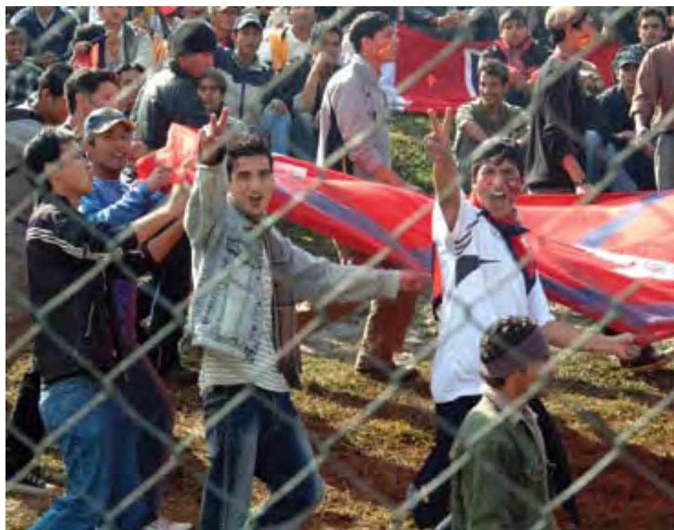
Top: A packed arena to watch the games and support the home team. Above: Fans of the Nepali Cricket team gave a moral boost to the team.

has been drawn with England in the preliminary round. Though Nepal has never defeated England, England's loss to the third team of the group has always prevented Nepal's progress to second round. In 2001, Nepal beat Pakistan but England lost to Pakistan and the two Test nations entered next round. In 2003, Nepal beat South Africa and England handed win to South Africa to prevent Nepal from advancing.