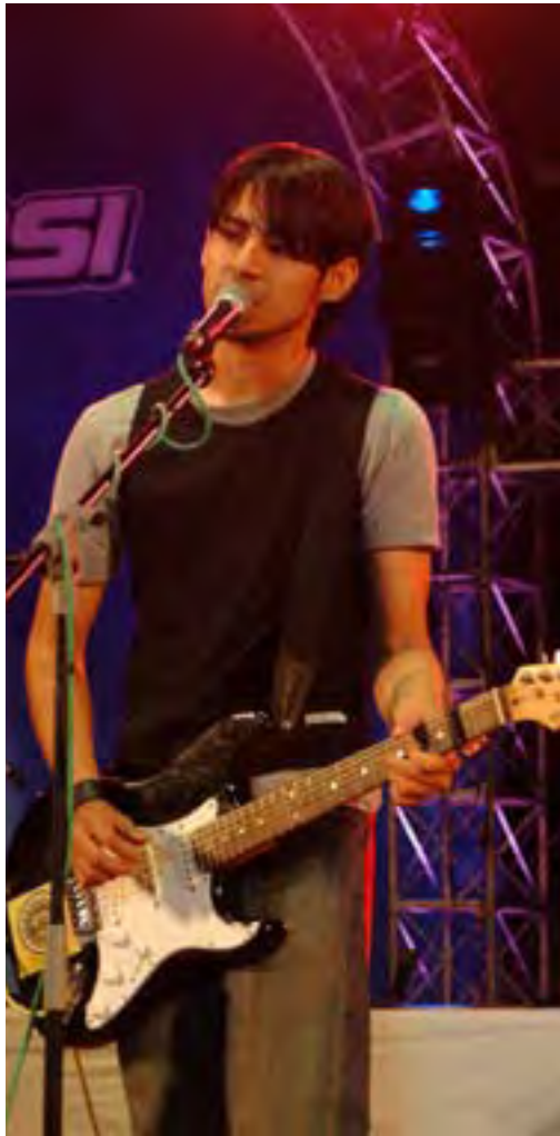
The Uglyz, performing at the last Image Awards, is nominated in 6 categories at the upcoming Hits FM Music Awards.

The biggest nominees of the year is the pop-rock group The Uglyz with 6 nominations including for the Best New Artist, Record of The Year and Best Song in Foreign Language. A full list of the categories and nominees is available at www.hitsfm.com.np