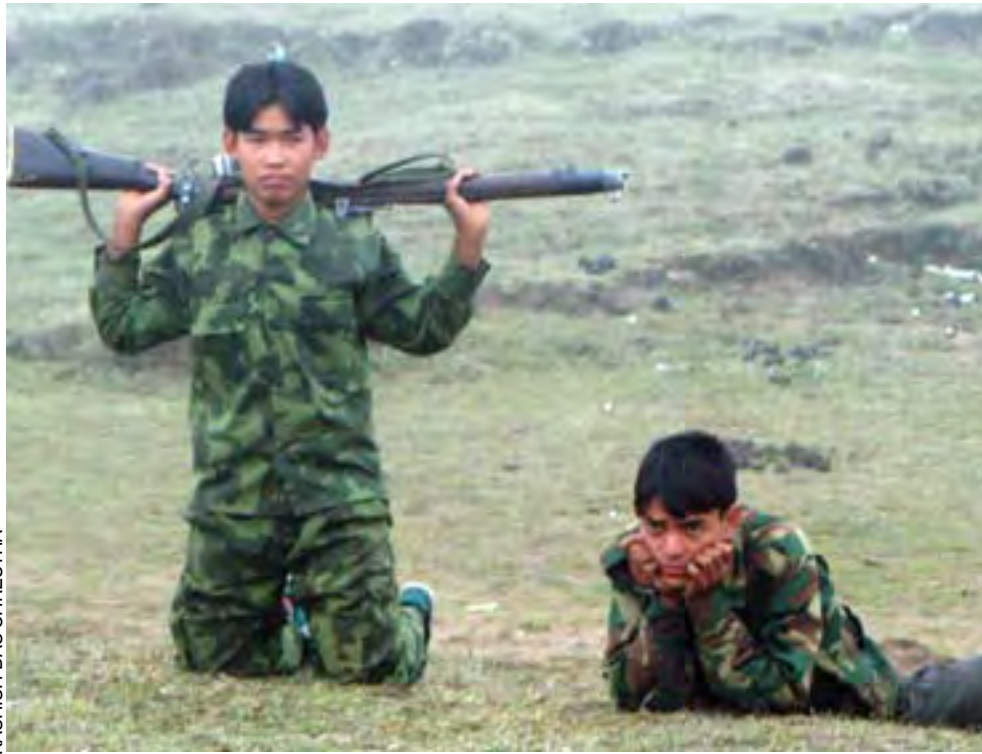
Young members of the Maoist militia in Eastern Nepal.