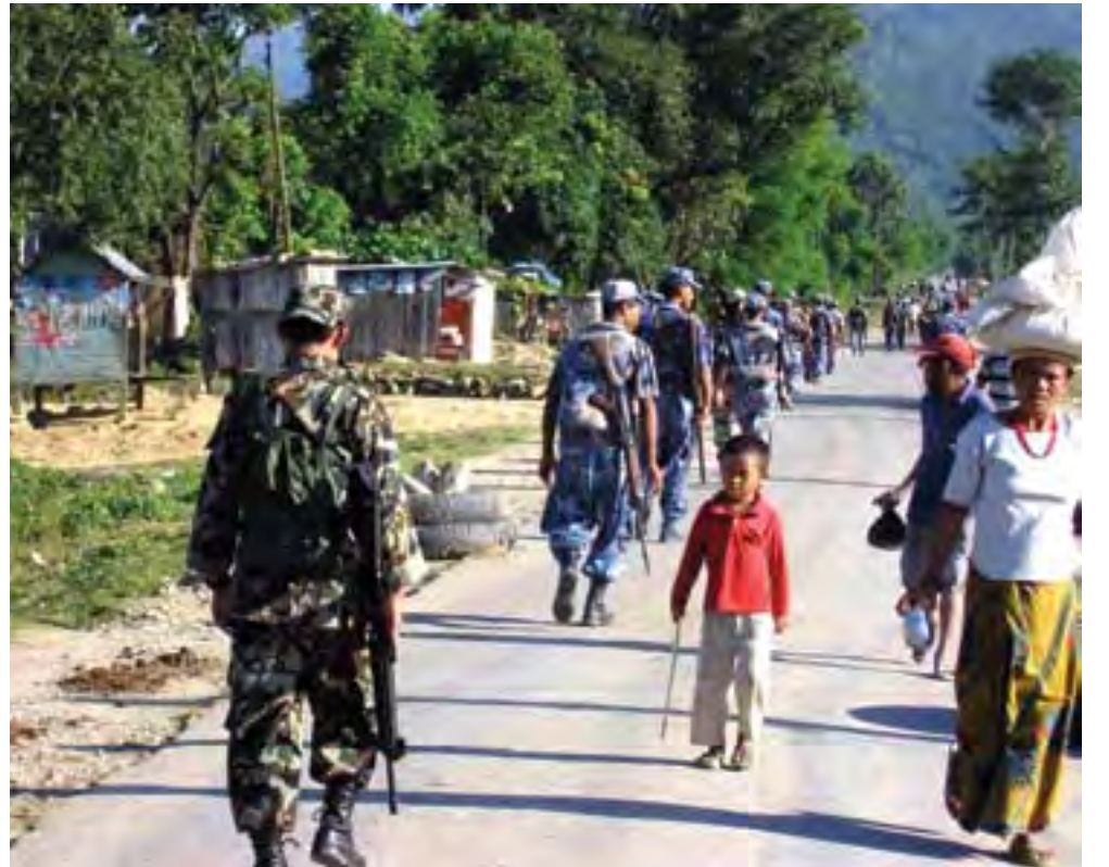
Top: A Maoist soldier poses for a photo in the jungles of Western Nepal. Above: Security forces on patrol to find Maoists.

माओवादी विद्रोह चर्किदै गएपछि पश्चिम नेपालका गाउँहरूमा राजनीतिक दलहरूको गतिविधि शुन्य अवस्थामा पुगिसकेको थियो। माओवादीको डरले दलका नेता र कार्यकर्ता गाउँ जान छाडिसकेका थिए। तर, माओवादीले गरेको तीनमहिने युद्धविरामको मौकामा अहिले गाउँगाउँमा दलहरूका कार्यक्रम भइरहेका छन्। नेपाली कांग्रेस र नेकपा एमालेले त गाउँजागरण कार्यक्रम नै संचालन गरिरहेका छन्।