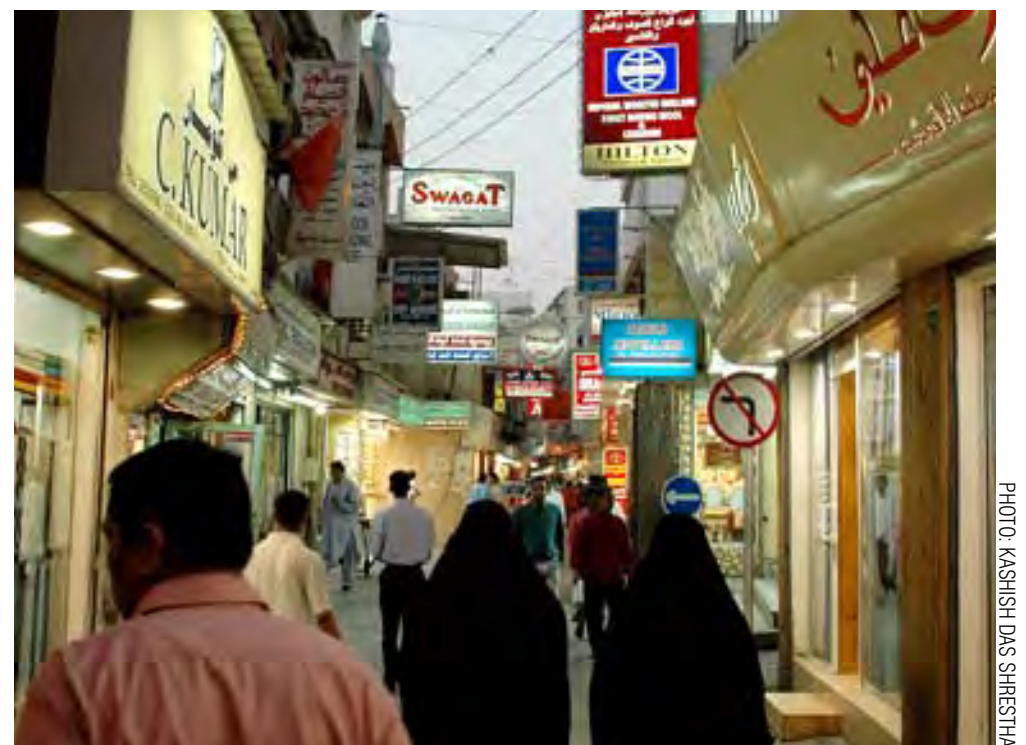
Nepalis can be found working in the old city of Manama, Bahrain

In this photo feature, we capture several groups of Nepalis traveling to the Gulf for work with representatives of their respective manpower agencies. The age group ranged from adolescents to middle aged men.