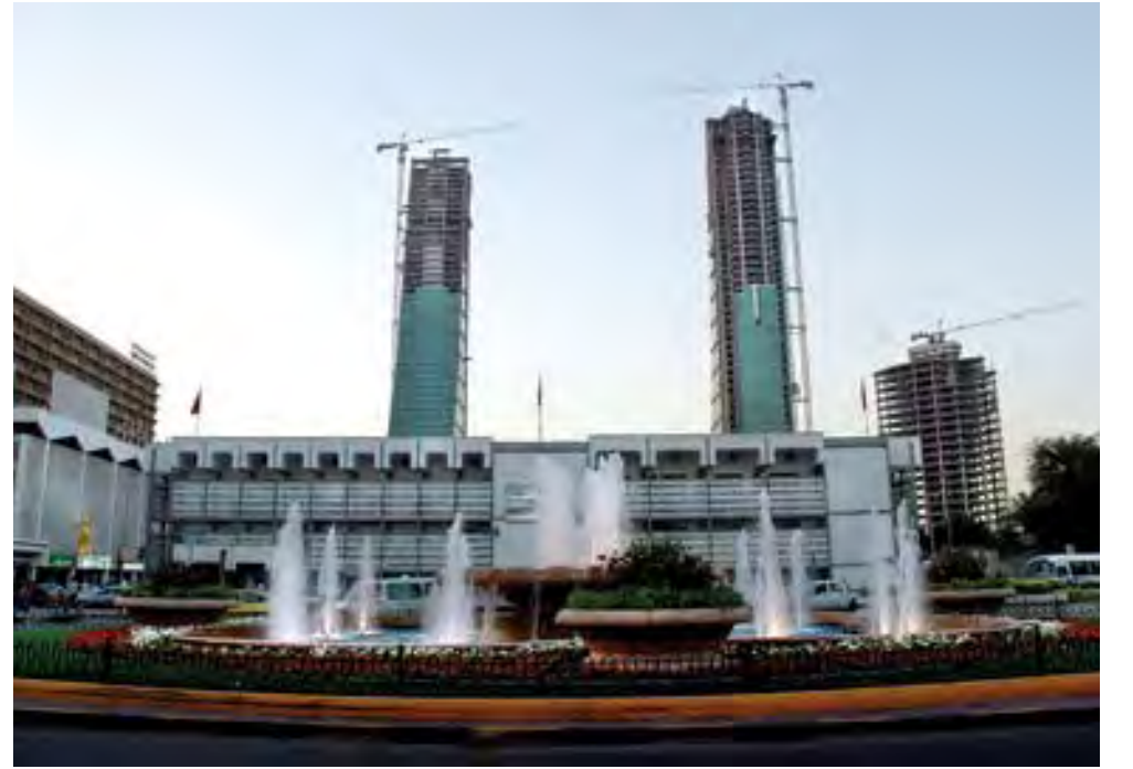
Bahrain's strong ever-growing economy creates several job opportunities for Nepalis

मेहनत र खर्च समेत परेको बताउछिन । भन्छिन-“टक्टरले तीन चास र गोरुले एक चास जोतियो, गोवर मल हालियो, मकैको ढोड जलाएर माटो मलीलो बनाईयो अनि रोपाई पछि १५ दिन सम्म पम्पबाट पानी लगाईयो । १५ हजार जति त खर्च नै गरियो मेहनत धेरै परे पनि उब्जनी अरुको हेरी दोब्बर नै छ ।”