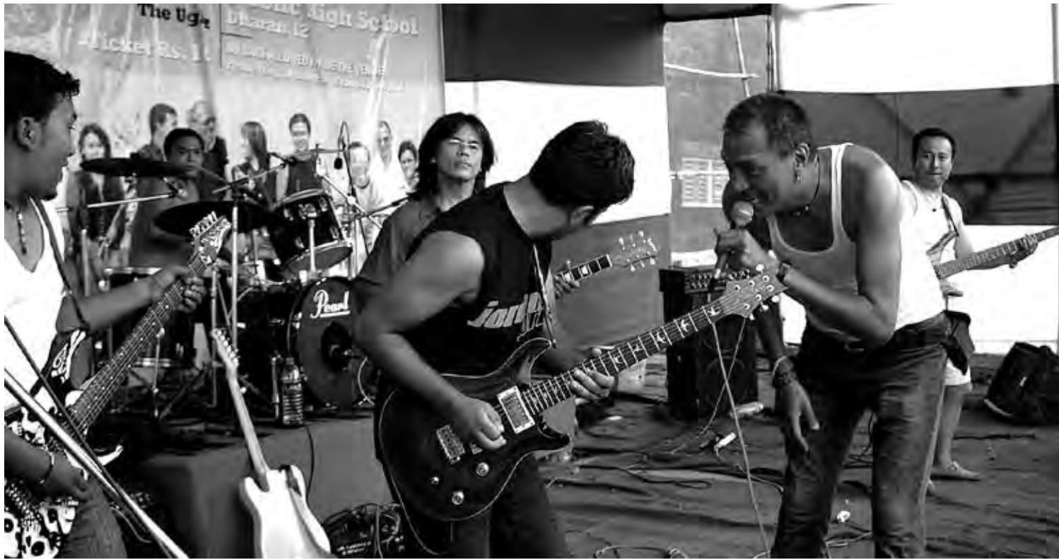
Robin and the New Revolution performs with 1974 AD in Dharan