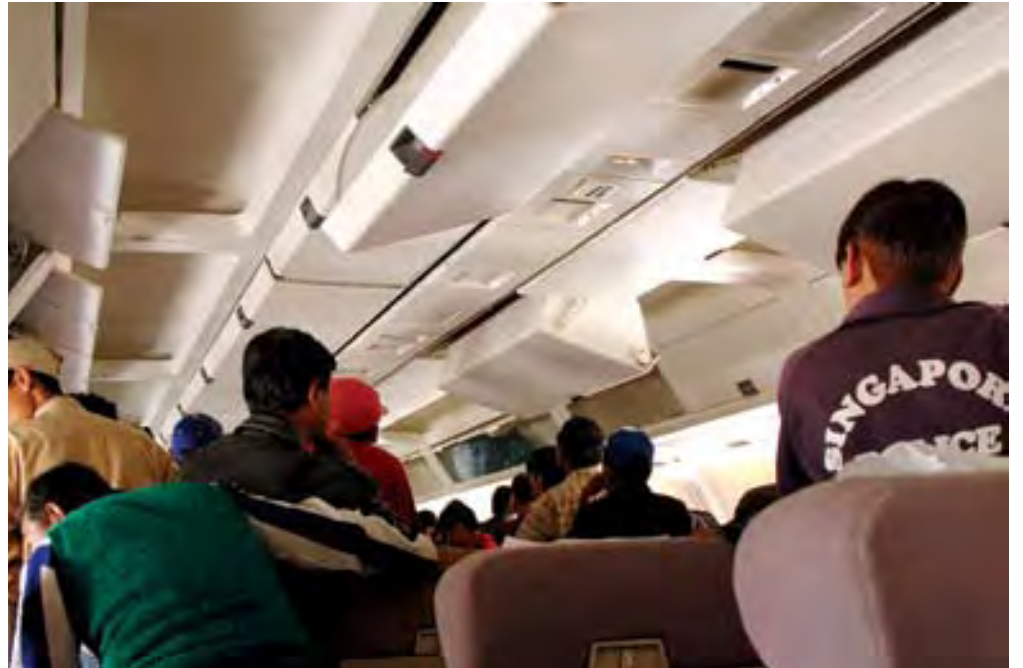
Nepali migrant workers peak curiously out the windows of the airplane in flight; eager to leave the plane once it's landed.