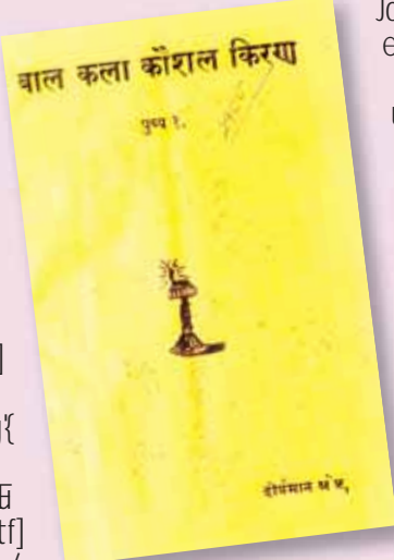
qndzll (आगामी अंकमा चित्रकला सिक्न-सिकाउन चाहिने सर-सामान र ज्याबलहरू)

#= dflv pNn]v ul/P d'tfl]s lraq n]vg cEof; afnssf]lgldQ laNsh ; j fe]lj s / clgjfo{lzlff xf] egl dfgotf lbP d'tfl]s lzlfsn]lgDgnlvt s'f/x;df k'fk' Wofg k'ofpgk5{gg eg]of]sfo{; km xg]sg}; Dej 5g . lzlfsf] sNkgf, rftb{ lzNk ; do ; xfp]f] lfdt, kl/l:ylt / :yfgs]lj rf/n]lgDgnlvt sfo{k'f ugdf k'f of]u lbg$ . / ”